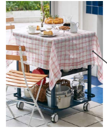
移動してテーブルクロスをかけたら、カフェテーブルに早変わり。