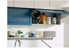
飾り棚にちょうどいい人造大理石のハンディーシェルフ（選択オプション）