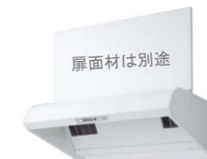
サイクロンフード3 扉面材タイプ ホワイト CFA903HAMK