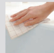
汚れのたまりやすい段差がないのでお手入れが簡単です。