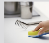
キズがつきにくく、万が一キズがついてしまっても、ナイロンたわしで補修できます。