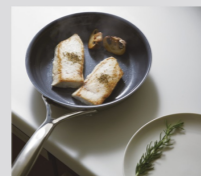
シンク、カウンター共に、熱や衝撃に強い厚みと高い性能を備えています。