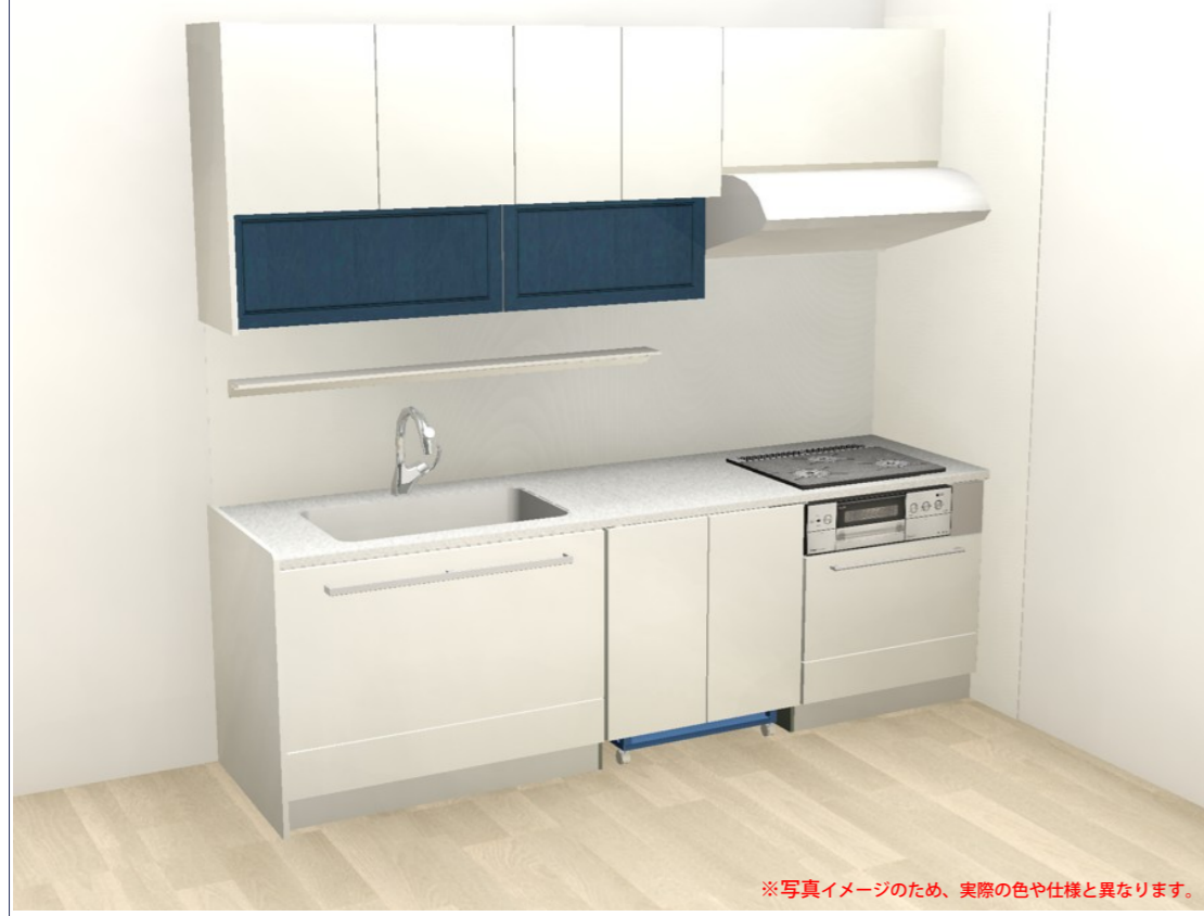
※写真イメージのため、実際の色や仕様と異なります。