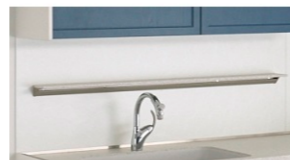
ハンディーシェルフ 人造大理石ハイグラーナホワイト