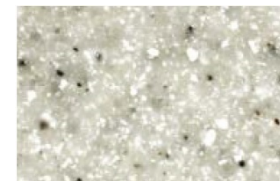
ハイグラーナホワイト