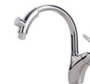
グースネック ハンドタッチシャワー水栓 TKN34PBT(Z)YL (TOTO)