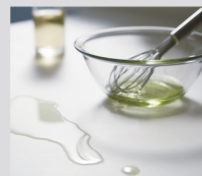
調味料などが染み込みにくく、毎日の水拭きだけで清潔さを保てます。