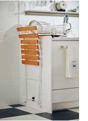
※ご提案プランの仕様と異なる場合があります。