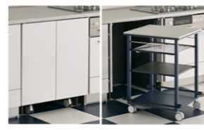
閉じた状態 開いた状態 スライドイン扉付キャビネット ワークトップワゴンあり